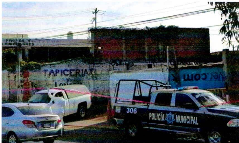
Asesinan a varón vestido de mujer en Mazatlán

El suceso ha causado consternación en la comunidad de Mazatlán.